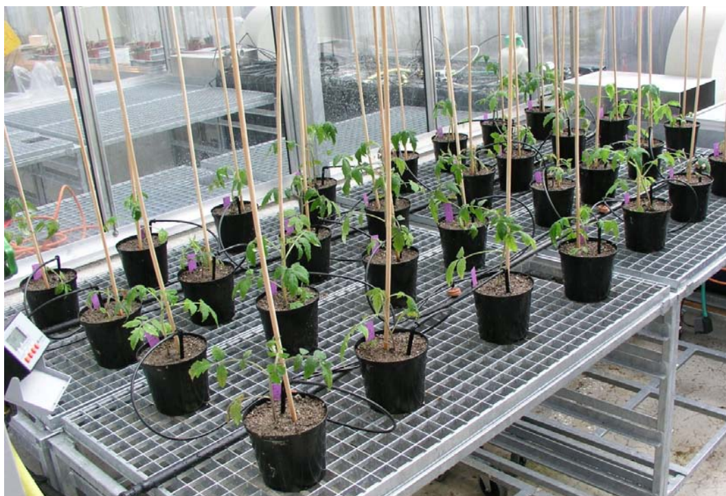
Abb. 1: Töpfe nach der Tomatenpflanzung im Gewächshaus.

Biofumigation ist ein biologisches Verfahren um Krankheiten, Schädlinge und Unkräuter im Boden zu reduzieren. Kreuzblütler-Pflanzen mit hohem Glukosinolatgehalt werden für etwa zwei Monate als Zwischenfrucht im Feld angebaut. Diese werden zur Vollblüte gemulcht und schnell in den Boden eingearbeitet. Bei der Zersetzung der Glukosinolate im Boden entstehen gasförmige und unter anderem auch für Nematoden giftige Stoffe. Neben der klassischen Einarbeitung von frischem Pflanzenmaterial stehen heute Pellets (BioFence, Fa. Triumph Italia) aus getrockneten Kreuzblütlern zur Verfügung. Ein Vorteil dieser Pellets ist, dass die Zeit zur Kultivierung der Zwischenfrüchte entfällt, womit auch im Gewächshaus eine Biofumigation möglich ist. Ausserdem findet ohne den Anbau von Zwischenfrüchten als potentielle Wirtspflanzen auch keine Nematodenvermehrung statt. Ziel der vorliegenden Untersuchung war es, die Eignung von BioFence Pellets zur Bekämpfung des Wurzelgallenematoden Meloidogyne arenaria in Topfversuchen zu ermitteln.