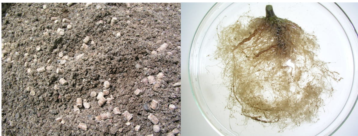
Abb. 2: Pellets vor der Einarbeitung und Wurzel mit Gallen bei der Auswertung.

In den Jahren 2008 und 2009 wurden insgesamt drei Topfversuche durchgeführt. Bei zwei Versuchen wurde jeweils die empfohlene Aufwandmenge von 2,5 t/ha BioFence Pellets bzw. Agro Biosol (organischer N-Langzeitdünger auf Chitinbasis = Pilzzellwände, Fa. Andermatt Biocontrol AG) eingearbeitet und mit Meloidogyne arenaria inokuliert (Versuch 1: 2600 Eier und Larven/Topf; Versuch 2: 2400 Larven/Topf). Bei Versuch 3 (2500 Eier und Larven/Topf) wurde die Aufwandmenge Pellets gesteigert (0,5, 1,5, 2,5, 3,5 und 4,5 t/ha). Nach der Applikation der Pellets und der Inokulation von M. arenaria wurden die Töpfe bewässert und mit Folie abgedeckt um die Wirkung der Biofumigation zu verbessern. Nach sieben bis zwölf Tagen wurden Tomaten gepflanzt und im Gewächshaus unter kontrollierten Bedingungen aufgestellt (Abb. 1). Nach 10 bis 12 Wochen bei 25°C wurde das Spross- und Wurzelgewicht, der Wurzelgallenindex und die Vermehrungsrate P_f/P_i ermittelt.