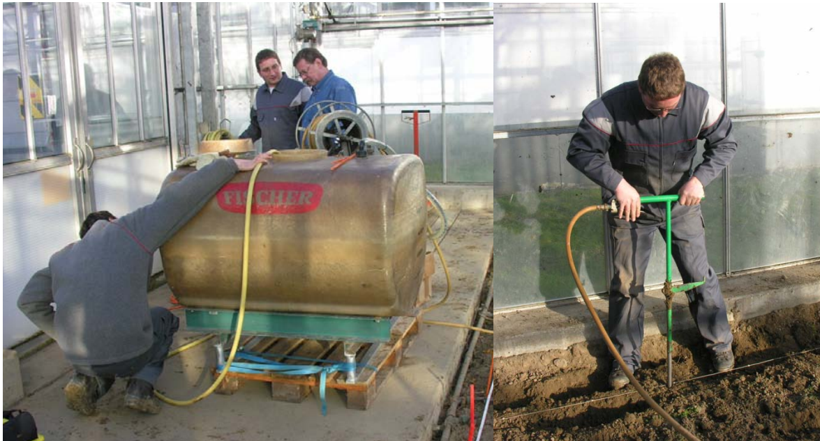
Abb. 4: Vorbereiten der Zucker-Harnstoff-Lösung und Ausbringen mit der Düngerlanze.

61% reduzierte Vermehrungsrate. In der anderen Parzelle konnte hingegen kein Unterschied zur Kontrolle festgestellt werden.