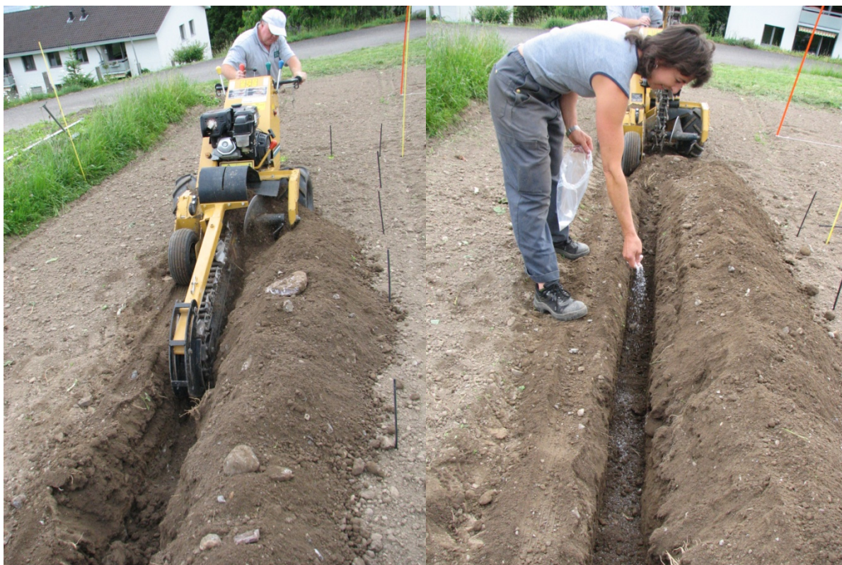
Abb. 1: Öffnen des Bodens mit einer Grabenfräse und anschließend Streuen von Zucker und Harnstoff.

Verschiedene Pilze wie z. B. Chalara werden schon in geringen Konzentrationen innerhalb kurzer Zeit durch das Zellgift Ammoniak ( \text{NH}_3 ) abgetötet. Dies konnte in Laborversuchen der Forschungsanstalt ACW nachgewiesen werden. Durch das Ausbringen von Zucker zusammen mit Harnstoff wird der Sauerstoff in der Bodenluft zu \text{CO}_2 veratmet und Ammoniak aus dem Harnstoff freigesetzt. Dieses Ammoniak-Gas steigt in den Bodenporen nach oben und tötet auf dem Weg Pilzsporen ab. Wie sieht das in der Praxis aus und was passiert mit den Nematoden?