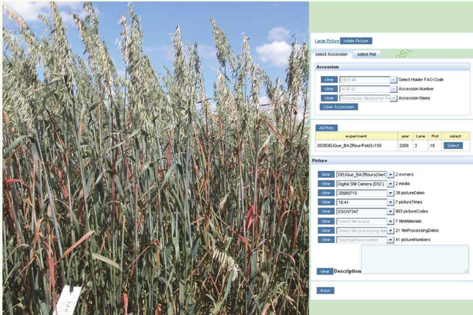
Abb.6 Parzellenorientiertes Einlesen von Bildern ( http://aveqprod.jki.bund.de ) Fig. 6 Plot wise upload of pictures ( http://aveqprod.jki.bund.de )

Zur Darstellung der morphologischen Vielfalt oder zu dokumentarischen Zwecken können Fotos zu einzelnen Versuchspartellen parzellenorientiert eingelesen werden. Aus dem Feldplan werden automatisch Passportdaten zugeordnet.