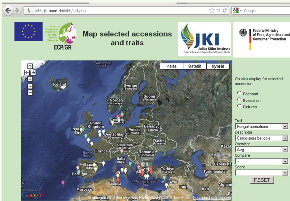
Abb. 4 Fundorte werden geographisch dargestellt und entsprechend eines Resistenzmerkmals eingefärbt oder gefiltert ( http://idbb.jki.bund.de ) Fig. 4 Collecting sites are displayed on a map and coloured or filtered according to the expression of a disease resistance ( http://idbb.jki.bund.de )