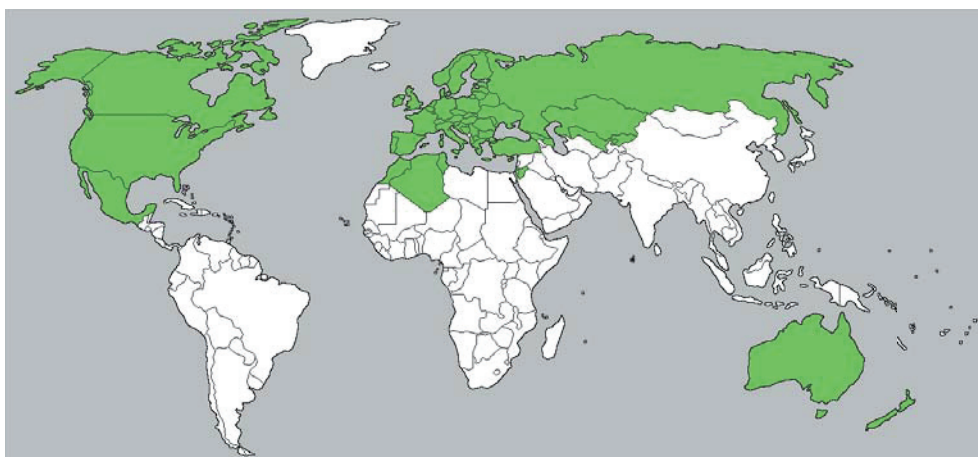
Abb. 1. Euphresco Partner Stand April 2020. Quelle Euphresco https://www.euphresco.net/about/members .