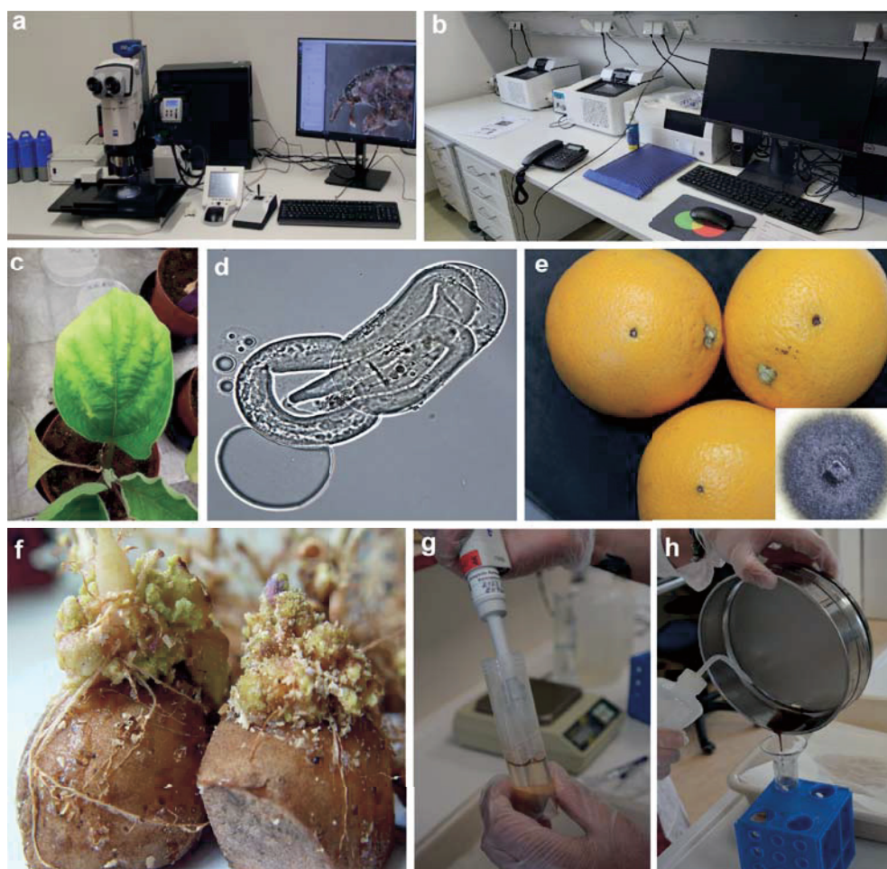
Abb. 1. Beispiel einiger im NRL JKI verwendeten Geräte bzw. Methoden und abgedeckten Schadorganismen bzw. Pflanzenkrankheiten. a) Stereomikroskopie (Insektenuntersuchung). b) Droplet digital PCR (ddPCR). c) Symptome von Clavibacter sepedonicus an anfälligen Aubergine-Testpflanzen. d) Schlüpfende Juvenile von Globodera pallida . e) Symptome von Schwarzfleckkrankheit (CBS) an Orangen und Isolat des Erregers Phyllosticta citricarpa . f-h) Nachweis des Kartoffelkrebses ( Synchytrium endobioticum ) mittels Biotests und Nasssiebverfahren.

Außerdem erfolgt in der Quarantänebakteriologie die Diagnose weiterer, auch wirtschaftlich relevanter Schadorganismen. Dazu gehört der als prioritärer Schadorganismus eingestufte Erreger Xylella fastidiosa . Dieser Schadorganismus kann Biofilme im Xylem der Pflanzen bilden und besitzt ein extrem breites Wirtspflanzenspek-