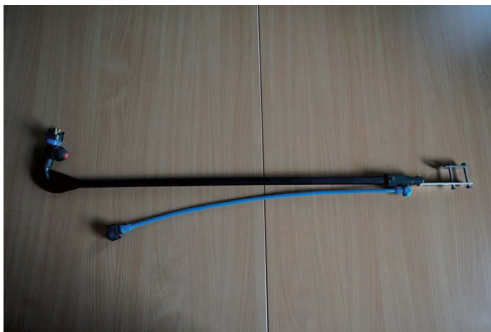
Abb. 1. Dropleg aus Kunststoff mit Tropfstopp-Ventil und Doppeldüsenhalter. Über eine Halterung werden sie am Spritzbalken befestigt und mit einem flexiblen Schlauch über einen Bajonettverschluss am Düsenstock angeschlossen.

Droplegs lassen sich an nahezu allen praxisüblichen Feldspritzen anbringen. Allerdings kann es bei einigen Bautypen Probleme beim Einklappen des Gestänges geben. So lassen sich einige Gestänge mit angebauten Droplegs nicht in Transportstellung klappen, ohne die Droplegs teilweise zu beschädigen. Bei einigen Anhängen-