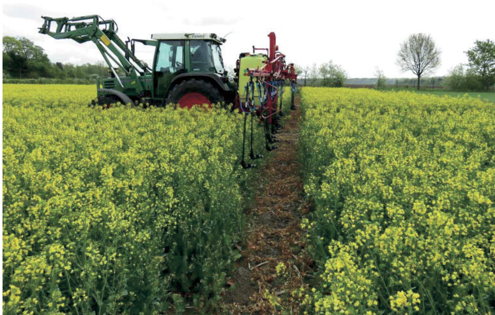
Abb. 2. Applikation von Pflanzenschutzmitteln in der Rapsblüte mit Dropleg-Technik.

Der effektive Einsatz der Dropleg-Technik zur Bekämpfung der Weißstängeligkeit ( S. sclerotiorum ) in Raps ist vielfach beschrieben. Auch am JKI wurden Versuche mit Droplegs und konventioneller Spritztechnik zur Bekämpfung der Weißstängeligkeit durchgeführt (ZAMANI-NOOR, 2016). Im Versuchsjahr 2016 gelang dank künstlicher Inokulation und Beregnung des Bestandes eine deutliche Erhöhung der Sclerotinia -Befallshäufigkeit. Die Applikation von Fungiziden mit Dropleg-Technik führte zu gleichen Bekämpfungserfolgen wie die konventionelle Applikation in die Blüte. Es gab keine signifikanten Unterschiede zwischen Dropleg- und konventioneller Behandlung bezüglich Befallshäufigkeit, Ertrag und TKG. Ähnliche Ergebnisse, auch unter hohem Befallsdruck, wurden über mehrere Jahre an der Fachhochschule Südwestfalen (HABERLAH-KORR, 2016; 2018; 2019; HABERLAH-KORR et al., 2018), bei Bayer CropScience (TERHARDT et al.,