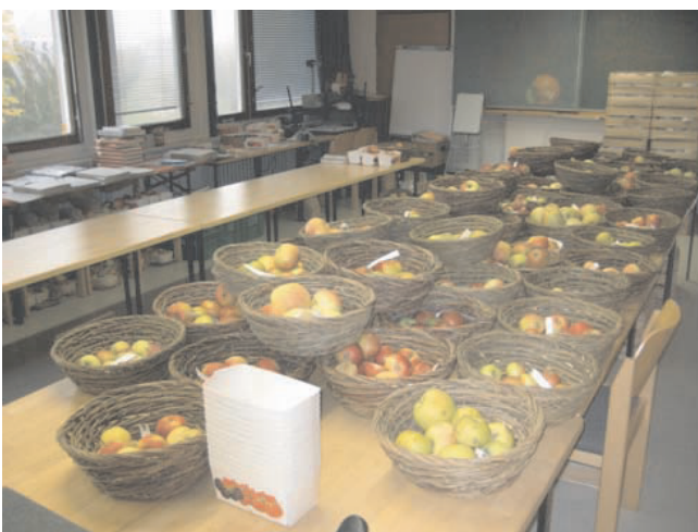
Abb. 1. Pomologische Bestimmung der Apfelsorten. Die pomologische Bestimmung der in der DGO zu erhaltenden Apfelsorten wird vom KOB Bavendorf in Zusammenarbeit mit dem Pomologen-Verein e. V. durchgeführt.

Im Oktober 2009 wurde das Apfelnetzwerk der DGO gegründet. Dieses Netzwerk ist mit sechs „Sammlungshaltenden Partnern“ und bislang 950 als „erhaltenswert“ eingestuft Apfelsorten das größte der DGO. Einer der „Sammlungshaltenden Partner“ ist die Stiftung Kompetenzzentrum Obstbau – Bodensee (KOB), die gleichzeitig auch die pomologische Bestimmung der zu erhaltenden Apfelsorten durchführt (Abb. 1). Das KOB liegt im südlichsten Obstanbaugebiet Deutschlands, der Obsterregion Bodensee. Ihre Versuchsfelder und Einrichtungen befinden sich auf einem knapp 30 ha großen Areal in der Nähe von Ravensburg (Abb. 2). Ziele dieser Einrichtung sind die Förderung des Obstanbaus in der Bodenseeregion und damit der Erhalt der dort gewachsenen Kulturlandschaft. Dabei werden Aufgaben an der Nahtstelle zwischen Wissenschaft und Praxis übernommen. Hierzu zählt einerseits die an den Standort gebundene, grundlagenorientierte Forschung. Andererseits soll durch anwendungsorientierte Untersuchungen und Beratung, aber auch durch grenzüberschreitende Zusammenarbeit mit Einrichtungen anderer Obsterregionen die Umsetzung der Forschungsergebnisse in die obstbauliche Praxis gefördert werden.