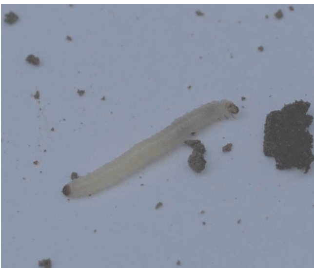
Abb. 2. Diabrotica – Larve.

Die Larven sind gelblich-weiß und besitzen Beine (Abb. 2). Die Größe der Larven variiert je nach Stadium zwischen 3 und 15 mm und wird durch Umweltbedingungen beeinflusst. Untersuchungen ergaben, dass auch die Bewässerung von Feldern einen positiven Effekt auf die Zunahme der Größe haben kann. Dies hat auch Auswirkungen auf den Grad der Wurzelschädigung, die Vitalität des Mais, und die Notwendigkeit der Bekämpfungsmaßnahmen (AGOSTI et al., 2009).