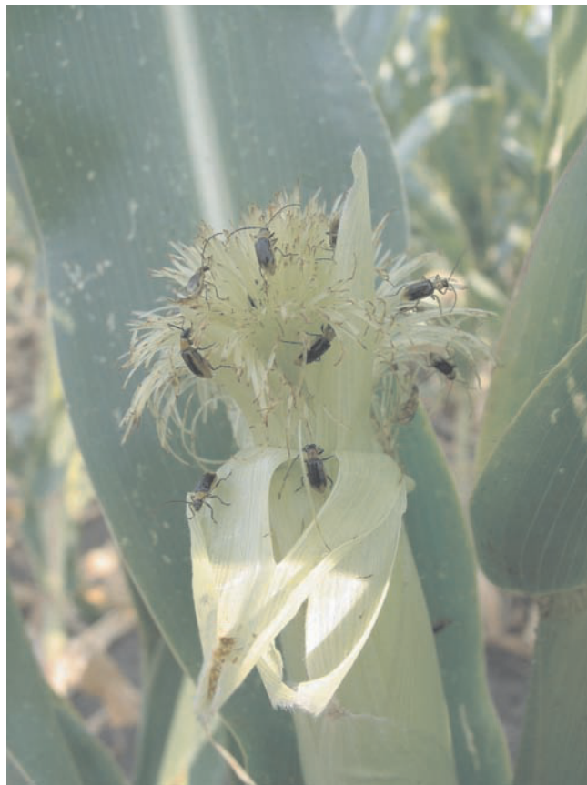
Abb. 5. Bevorzugtes Käferfutter („silk clipping“) (Quelle: BAUFELD, JKI).