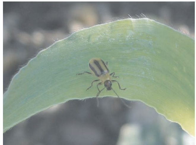
Abb. 1. Diabrotica – adultes Tier.

Der Westliche Maiswurzelbohrer, Diabrotica virgifera virgifera LeConte, gehört zur Familie der Blattkäfer (Chrysomelidae). Er ist die einzige in Europa vorkom-