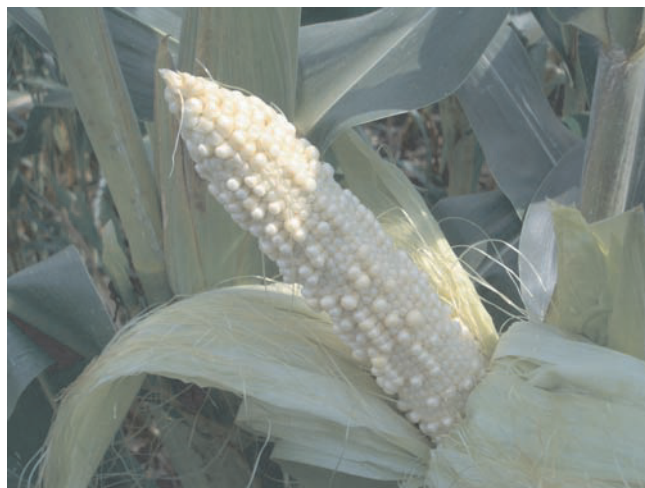
Abb. 6. Verschiedene Korngrößen durch Schädigung während der Befruchtung (Quelle: HEIMBACH, JKI).

(Entscheidung 2006/564/EG) sowie 2008 durch den Artikel 4 (Entscheidung 2008/644/EG) ergänzt wurden. Bei Einschleppung von Diabrotica in bisher befallsfreie Gebiete werden sofort Ausrottungsmaßnahmen ergriffen, mit dem Ziel, die geringe Anzahl von Käfern zu vernichten, um das Gebiet über viele Jahre befallsfrei zu halten und um eine weitere Ausbreitung zu verhindern. Der Erfolg von Ausrottungsmaßnahmen hängt entscheidend von der rechtzeitigen Feststellung einer Einschleppung ab. Werden punktuelle Einschleppungen frühzeitig erkannt und sofortige Gegenmaßnahmen durchgesetzt,