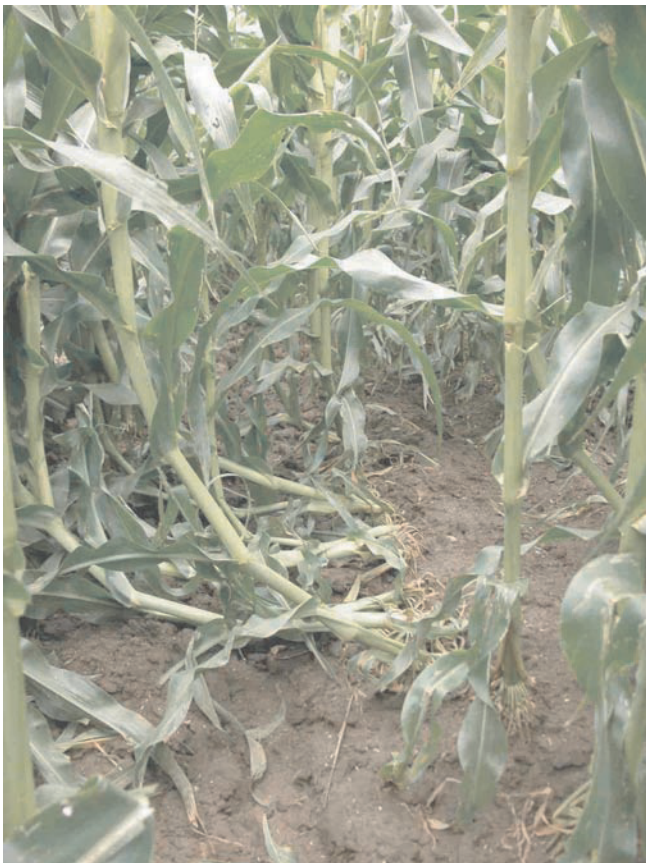
Abb. 4. Wiederaufrichten der durch Diabrotica geschädigten Maispflanzen („goose necking“).