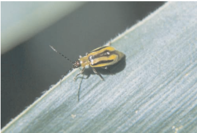
Abb. 1a. Diabrotica – weiblicher Käfer (Quelle: ZELLNER, LfL).