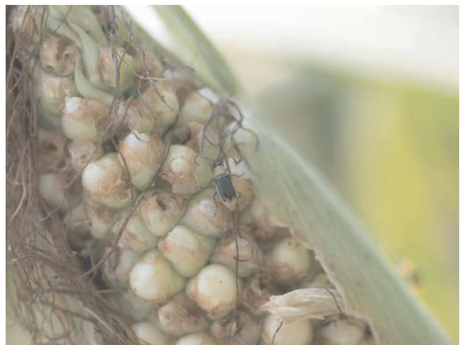
Abb. 1b. Diabrotica – männlicher Käfer.