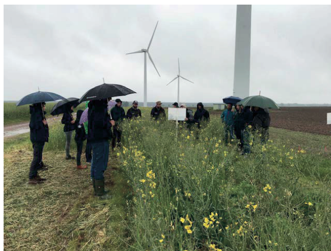
Abb. 3. Versuche der DSV Bückwitz zu Untersaaten im Öko-Rapsanbau