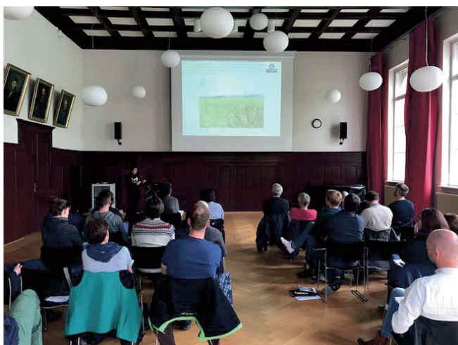
Abb. 1. 36 Teilnehmer verfolgten die Vorträge aus Wissenschaft, der Praxis der Ölmühlen und des Anbaus