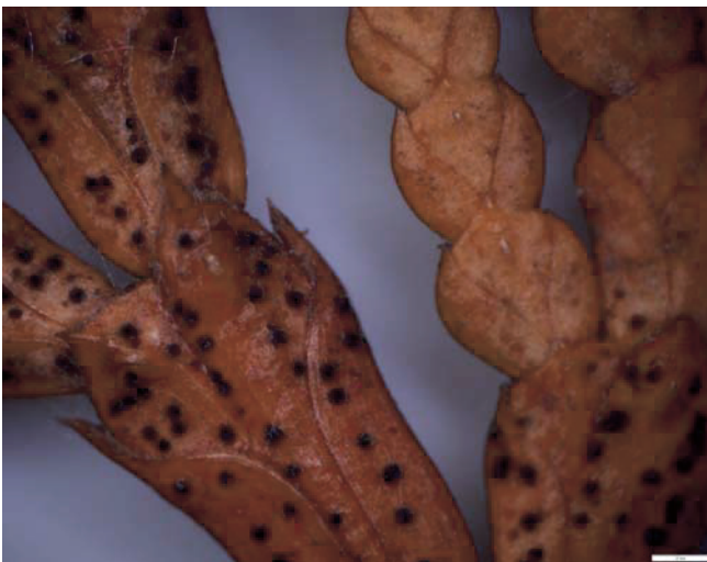
Abb. 1. Pyknidien von Phyllosticta thujae auf den Blattschuppen