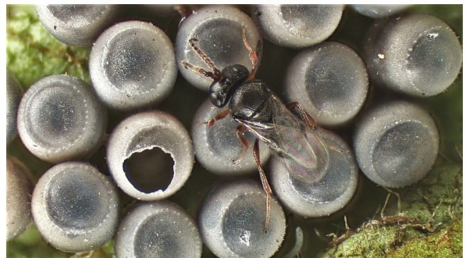
Abb. 6. Eiparasitoid Trissolcus japonicus („Samuraiwespe“). Ein Männchen von T. japonicus (Hymenoptera: Scelionidae) kurz nach dem Schlupf auf einem Eigelege der Marmorierten Baumwanze (Hemiptera: Pentatomidae).

Parasitoide, vor allem Arten in den Familien Scelionidae, Eupelmidae (Hymenoptera) und Tachinidae (Diptera), gehören zu den wichtigsten natürlichen Gegenspielern von Baumwanzen. Dabei sind es v. a. Arten der Gattungen Trissolcus (Hymenoptera: Scelionidae) (Jones, 1988; Orr, 1988) und Anastatus (Hymenoptera: Eupelmidae) sowie Telenomus (Hym.: Scelionidae), die erfolgreich Eigelege von Stinkwanzen parasitieren (Dieckhoff et al., 2017; Costi et al., 2019; Stahl et al., 2019a). Arten in der Gattung Trissolcus spp. sind auf eine oder einige wenige Wirtsarten aus derselben Gattung oder nahe verwandten Gattungen in derselben Ordnung spezialisiert. Sie stellen somit ideale Kandidaten für Bekämpfungsstrategien im Sinne des biologischen Pflanzenschutzes dar. In Deutschland parasitiert Trissolcus basalis erfolgreich die Grüne Reiswanze im Freiland ebenso wie im geschützten Anbau (unveröffentlichte Daten LTZ). Zwei mit der Marmorierten Baumwanze im Ursprungsland Asien vergesellschaftete Eiparasitoide, T. japonicus und T. mitsukurii , wurden in Europa erstmals 2017 sowohl in Italien ( T. japonicus und T. mitsukurii ) als auch in der Schweiz ( T. japonicus ) nachgewiesen und 2020 dann auch in Deutschland ( T. japonicus ) (Peverieri et al., 2018; Stahl et al., 2019b; Scaccini et al., 2020; Dieckhoff et al., 2021) (Abb. 6). Es ist davon auszugehen, dass diese Eiparasitoide zusammen