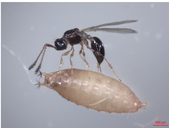
Abb. 4. Puppenparasitoid bei der Eiablage. Weibchen der Schlupfwespe Trichopria drosophilae (Hymenoptera: Diapriidae) bei der Eiablage in eine Puppe von Drosophila suzukii (Diptera: Drosophilidae) (Bildautorin: Camilla Englert, JKI).

Sie zeichnen sich durch ein sehr breites Wirtspflanzenspektrum aus und befallen Arten aus dem Kern- und Steinobstbereich ebenso gerne wie diverses Beerenobst. Besonders beliebt sind Birne, Apfel und Pfirsich sowie Vertreter der Sonderkulturen, z. B. Kiwi (Todd, 1989; Leskey & Nielsen, 2018). Bei einem frühen Befall der Früchte kann es durch die Saugschäden zum Abstoßen oder zu Verkrüppelungen der sich entwickelnden Früchte kommen. Ein später Befall kann bei der Ernte, in Abhängigkeit von Kultur und Sorte, unter Umständen zunächst unentdeckt bleiben und sich erst in der Lagerung entwickeln (Acebes-Doria et al., 2016; Bergh et al., 2019). Eine Direktvermarktung der geschädigten Früchte ist in der Regel nicht mehr möglich. Besonders H. halys hat sich zu einem wirtschaftlich bedeutenden Schadorganismus in den neu besiedelten Obstanbaugebieten entwickelt. Apfelanbauer in den mittelatlantischen Regionen der USA hatten 2010, knapp 20 Jahre nach der Einschleppung von H. halys ,