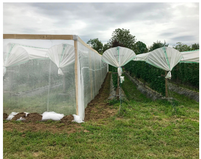
Abb. 1. Beispiel einer eingenetzten Obstanlage. Eingenetzte und nicht-ingenetzte Himbeeranlage mit Regenkapfen eines am Demonstrationsvorhaben zum „Einnetzen von Obstkulturen als Schutz gegen die Kirschessigfliege, Drosophila suzukii “ beteiligten Betriebes in NRW.

An dem Modell- und Demonstrationsvorhaben waren bis Ende 2019 insgesamt 22 Betriebe aus drei Bundesländern (BW, NI, NRW) beteiligt und bis Projektende im Dezember