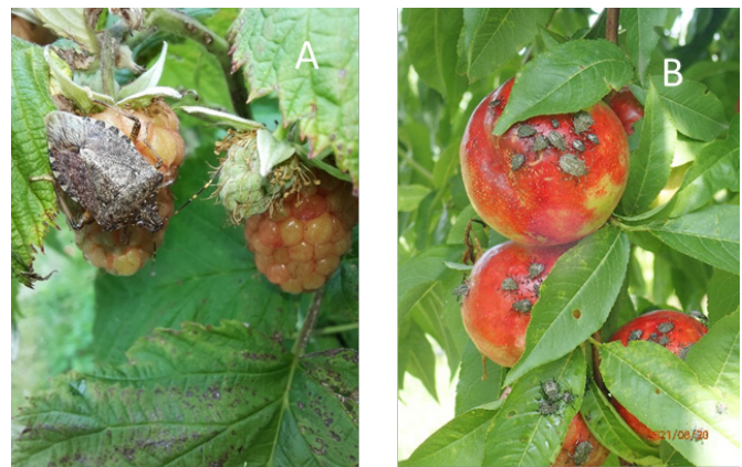
Abb. 5. Invasive Stinkwanzen auf Früchten. (A) Adulte Halyomorpha halys (Hemiptera: Pentatomidae) auf Himbeere; (B) Ansammlung von H. halys Nymphen auf Nektarinen. Unterschiedliche Entwicklungsstadien von Nymphen der Marmorierten Baumwanze saugen an Nektarinen.